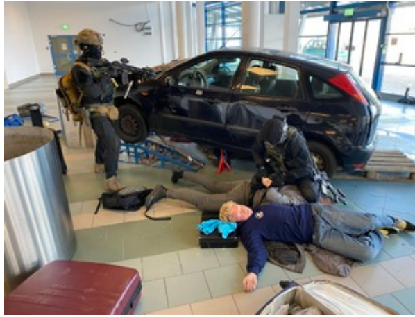
Trening służb na gdańskim lotnisku.