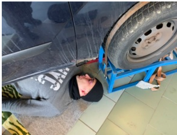
Trening służb na gdańskim lotnisku.