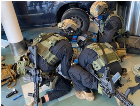
Trening służb na gdańskim lotnisku.