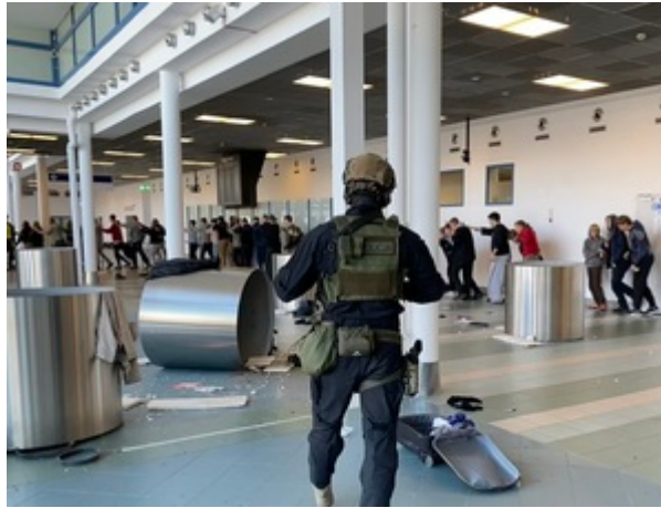
Trening służb na gdańskim lotnisku.