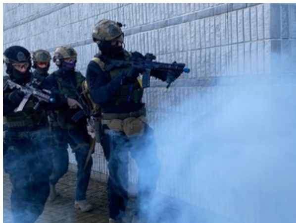
Trening służb na gdańskim lotnisku.

Trening ma na celu podnoszenie poziomu bezpieczeństwa i gotowości służb odpowiedzialnych za ochronę życia i zdrowia obywateli, w każdych, nawet najbardziej ekstremalnych, warunkach.