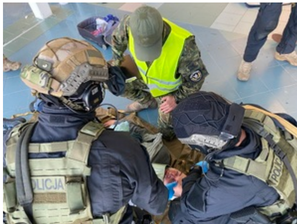
Trening służb na gdańskim lotnisku.