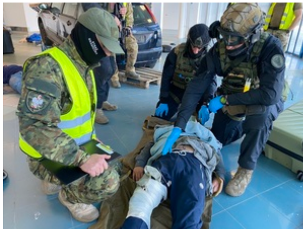
Trening służb na gdańskim lotnisku.