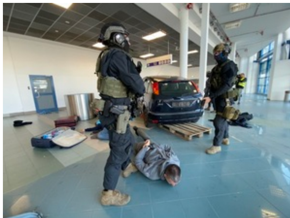
Trening służb na gdańskim lotnisku.