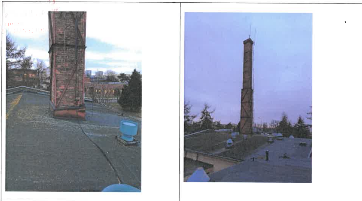
Komin nr 2- stopa fundamentowa żelbetowa pełna, trzon wykonany z cegły, ze stopniami z płaskowników.