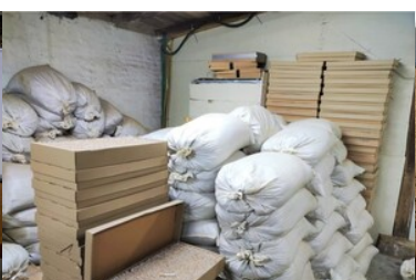
Zlikwidowana fabryka papierosów i krajalnie tytoniu