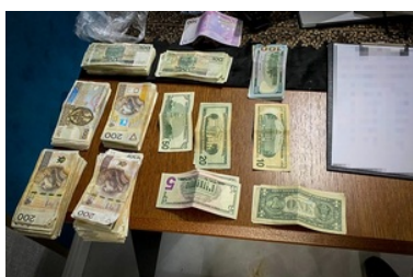
Zlikwidowana fabryka papierosów i krajalnie tytoniu