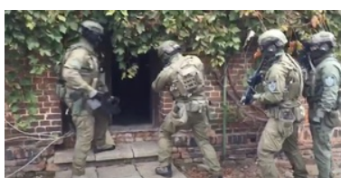
Zlikwidowana fabryka papierosów i krajalnie tytoniu

Sprawa ma charakter rozwojowy. Dalsze czynności prowadzą funkcjonariusze z Warmińsko-Mazurskiego Oddziału Straży Granicznej i policjanci z Zarządu w Olsztynie Centralnego Biura Śledczego Policji.