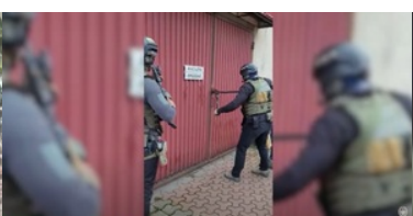
Zlikwidowana fabryka papierosów i krajalnie tytoniu