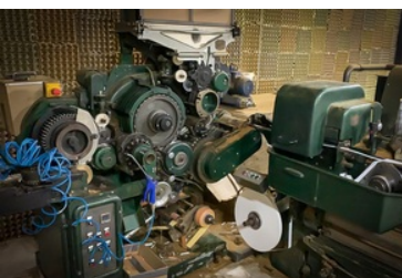
Zlikwidowana fabryka papierosów i krajalnie tytoniu