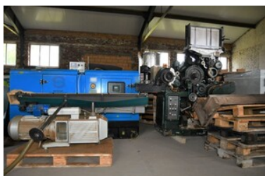
Zlikwidowana fabryka papierosów i krajalnie tytoniu