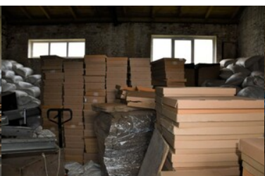
Zlikwidowana fabryka papierosów i krajalnie tytoniu