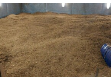
Zlikwidowana fabryka papierosów i krajalnie tytoniu