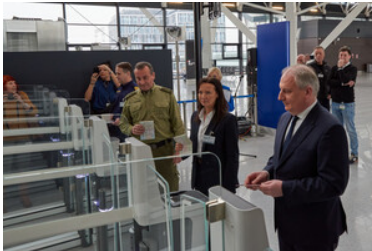
Otwarcie bramek ABC na lotnisku w Gdańsku.