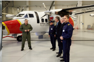
Wizyta w hangarze bazy statków powietrznych Straży Granicznej.