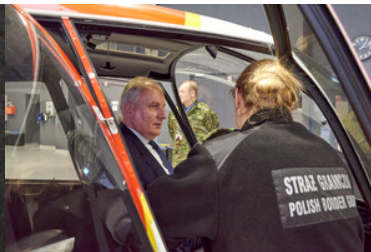
Wizyta w hangarze bazy statków powietrznych Straży Granicznej.