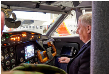
Wizyta w hangarze bazy statków powietrznych Straży Granicznej.