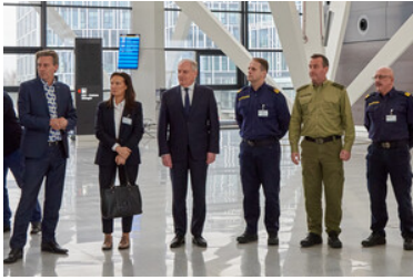
Otwarcie bramek ABC na lotnisku w Gdańsku.