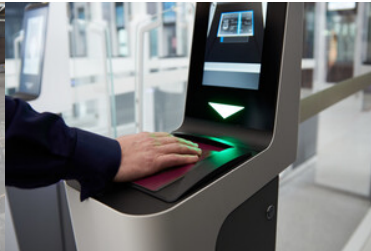
Otwarcie bramek ABC na lotnisku w Gdańsku.