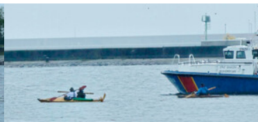
Akcja „Morskie Wiosłowanie - Celem Pomaganie”