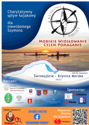
Akcja „Morskie Wiosłowanie - Celem Pomaganie”