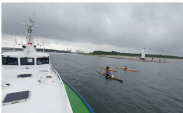
Akcja „Morskie Wiosłowanie - Celem Pomaganie”

Patronami akcji, oprócz Komendanta MOSG, są także m.in. Minister Sportu i Turystyki i Wojewoda Pomorski.