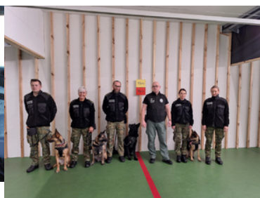
Psy Straży Granicznej podczas szkolenia.