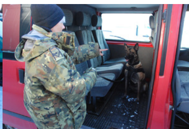
Psy Straży Granicznej podczas szkolenia.