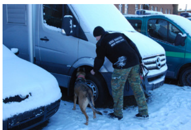
Psy Straży Granicznej podczas szkolenia.