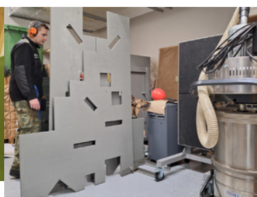
Psy Straży Granicznej podczas szkolenia.