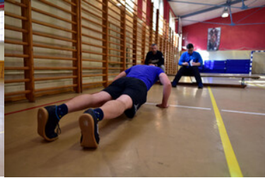
Egzaminy kandydatów do służby w MOSG.