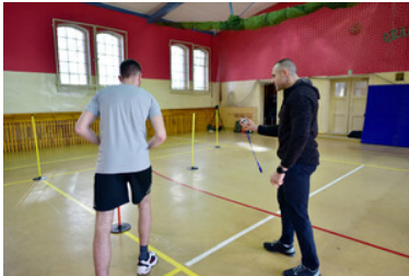
Egzaminy kandydatów do służby w MOSG.