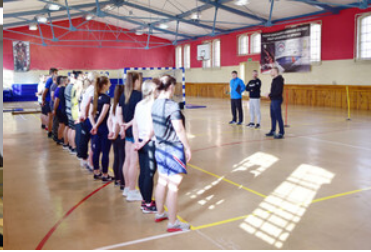
Egzaminy kandydatów do służby w MOSG.