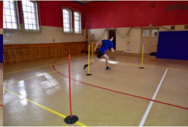
Egzaminy kandydatów do służby w MOSG.