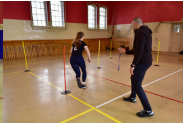
Egzaminy kandydatów do służby w MOSG.