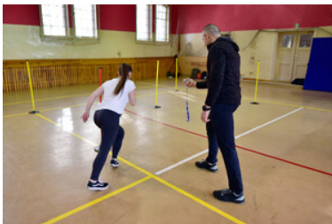
Egzaminy kandydatów do służby w MOSG.