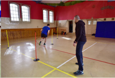
Egzaminy kandydatów do służby w MOSG.