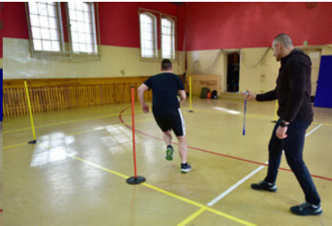
Egzaminy kandydatów do służby w MOSG.