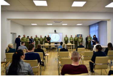
Egzaminy kandydatów do służby w MOSG.