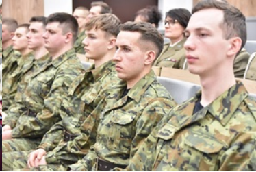
Pierwsza inauguracja roku akademickiego w Wyższej Szkole SG.