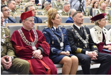
Pierwsza inauguracja roku akademickiego w Wyższej Szkole SG.