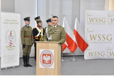
Pierwsza inauguracja roku akademickiego w Wyższej Szkole SG.