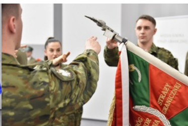
Pierwsza inauguracja roku akademickiego w Wyższej Szkole SG.