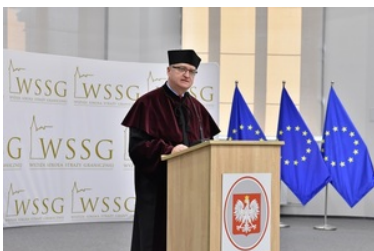
Pierwsza inauguracja roku akademickiego w Wyższej Szkole SG.