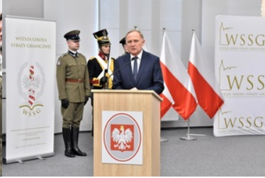
Pierwsza inauguracja roku akademickiego w Wyższej Szkole SG.