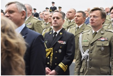
Pierwsza inauguracja roku akademickiego w Wyższej Szkole SG.