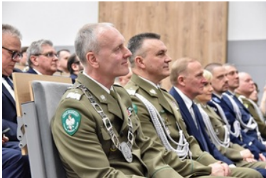
Pierwsza inauguracja roku akademickiego w Wyższej Szkole SG.