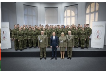
Pierwsza inauguracja roku akademickiego w Wyższej Szkole SG.