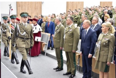
Pierwsza inauguracja roku akademickiego w Wyższej Szkole SG.