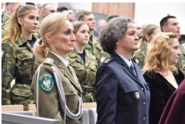
Pierwsza inauguracja roku akademickiego w Wyższej Szkole SG.