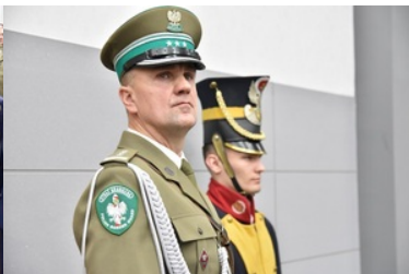
Pierwsza inauguracja roku akademickiego w Wyższej Szkole SG.