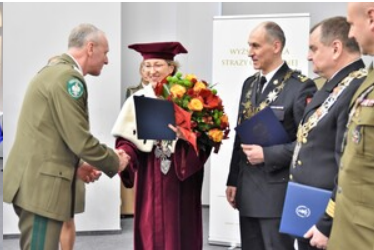
Pierwsza inauguracja roku akademickiego w Wyższej Szkole SG.