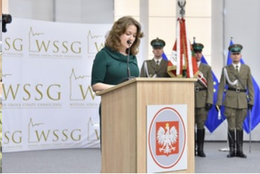
Pierwsza inauguracja roku akademickiego w Wyższej Szkole SG.