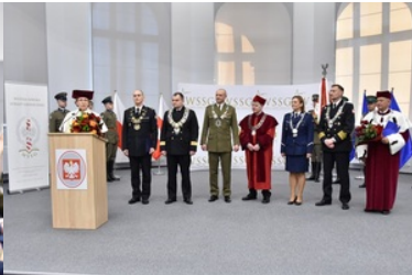
Pierwsza inauguracja roku akademickiego w Wyższej Szkole SG.