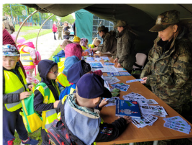
Promowali formację i nabór do służby.