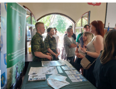
Promowali formację i nabór do służby.