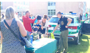
Promowali formację i nabór do służby.