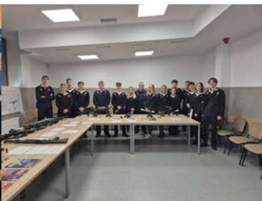
Promowali formację i nabór do służby.