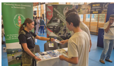
Promowali formację i nabór do służby.