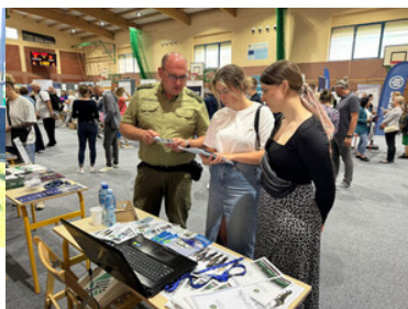
Promowali formację i nabór do służby.