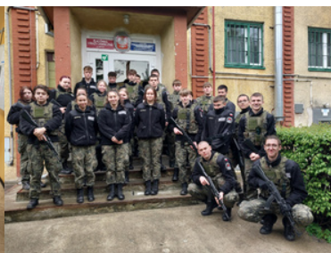
Promowali formację i nabór do służby.