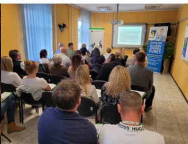
Promowali formację i nabór do służby.