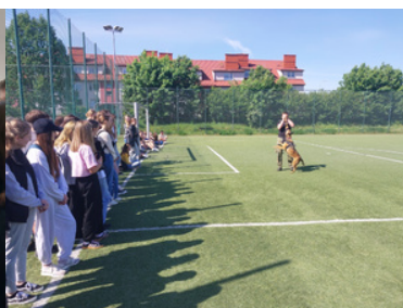
Promowali formację i nabór do służby.