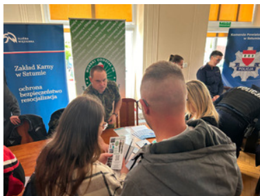
Promowali formację i nabór do służby.