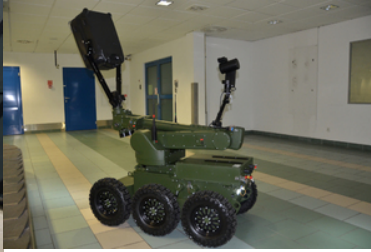
Robot pirotechniczny przewozi walizkę.