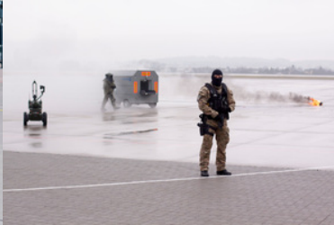
Pirotechnik SG neutralizuje bagaż.