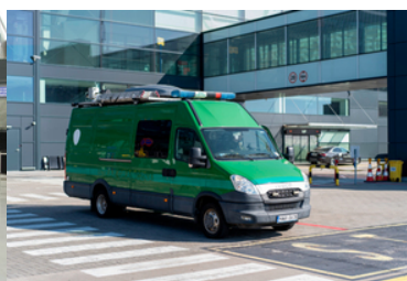
Pirobus SG.