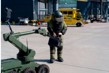
Pirotechnik SG bada bagaż.