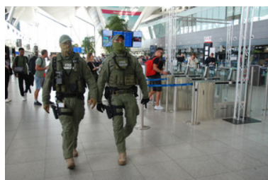
Funkcjonariusze SG w terminalu lotniska.

W razie konieczności we wszelkich kwestiach związanych z bezpieczeństwem na lotniskach oraz z przekraczaniem granic w lotniczych przejściach pasażerowie mogą kontaktować się z Placówką Straży Granicznej w Gdańsku przy ul. Słowackiego 200, tel. +48 58522 04 80 i Placówką Straży Granicznej w Szczecinie pod numer +48 91 466 55 20. Czynny jest też całodobowo telefon zaufania Morskiego Oddziału Straży Granicznej: +48 585242222.