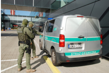
Funkcjonariusze przy pojeździe służbowym.