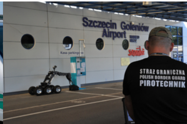
Robot przewozi walizkę.