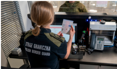
Funkcjonariuszka weryfikuje dokument.