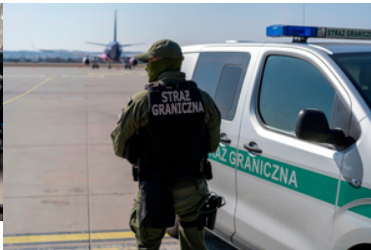
Funkcjonariusz przy pojeździe służbowym.