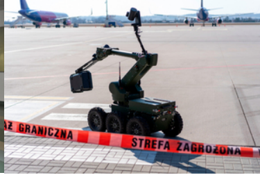
Robot pirotechniczny.