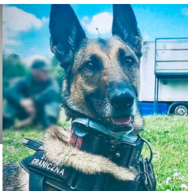
Hira, pies służbowy Straży Granicznej.