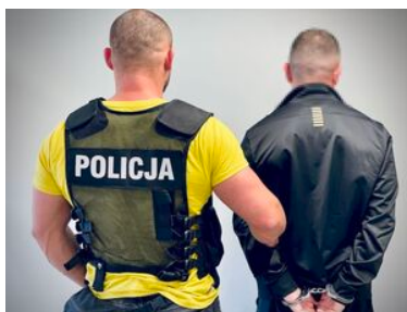
Funkcjonariusz z zatrzymanym mężczyzną.