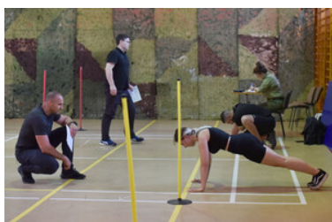
Egzaminy kandydatów do służby w MOSG.