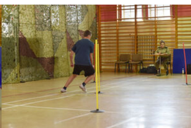
Egzaminy kandydatów do służby w MOSG.