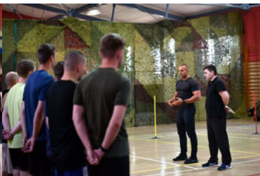
Egzaminy kandydatów do służby w MOSG.