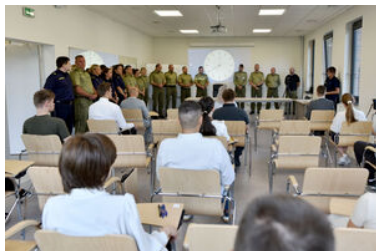
Egzaminy kandydatów do służby w MOSG.

branżowej szkoły II stopnia, nieposiadających w dniu rozpoczęcia postępowania kwalifikacyjnego dokumentów stwierdzających wykształcenie lub nieposiadających uregulowanego stosunku do służby wojskowej.