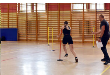
Egzaminy kandydatów do służby w MOSG.