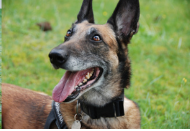
Didi - pies służbowy SG.