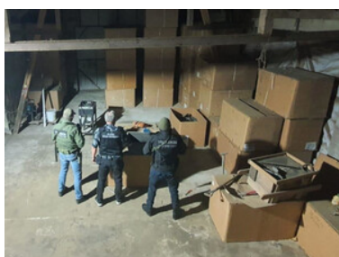
Funkcjonariusze ujawnili znaczne ilości nielegalnego tytoniu.

W wyniku przeszukań funkcjonariusze zajęli także maszynę do cięcia tytoniu, rozdrabniarkę, wagę oraz inne urządzenia służące do produkcji krajanki tytoniowej. Na czas czynności procesowych funkcjonariusze Straży Granicznej zatrzymali właścicieli posesji. Dalsze postępowanie w tej sprawie prowadzi Krajowa Administracja Skarbowa.