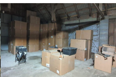
Funkcjonariusze ujawnili znaczne ilości nielegalnego tytoniu.