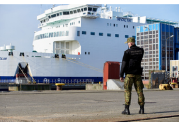
Funkcjonariusz SG na tle promu morskiego.