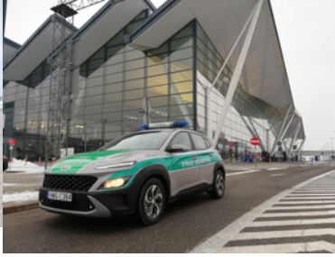
Pojazd służbowy Straży Granicznej przed terminalem pasażerskim gdańskiego lotniska.