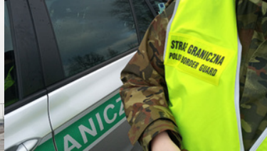
Napis Straż Graniczna na kamizelce odblaskowej. W tle fragment pojazdu służbowego SG.