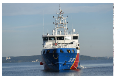
Patrolowiec SG-301.