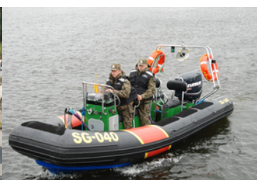
Dwóch funkcjonariuszy SG w rejsie na jednostce pływającej SG-040.