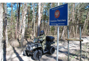
Funkcjonariusz na quadzie na drodze przygranicznej.