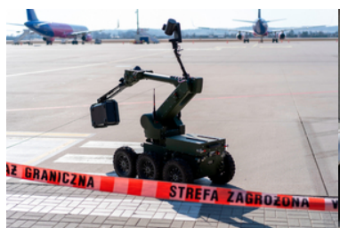
Robot pirotechniczny na płycie lotniska.