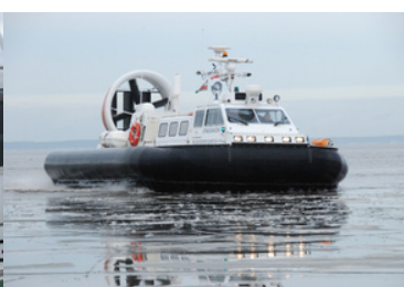
Poduszkuwec Straży Granicznej na wodzie.