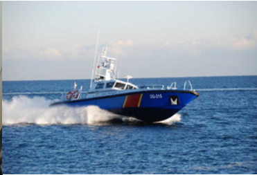
Jednostka pływająca SG-215.