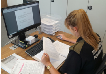
Funkcjonariuszka SG analizuje dokumentację.