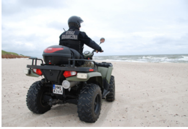
Funkcjonariusz SG kieruje quadem wzdłuż brzegu morskiego.