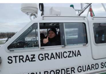
Napis Straż Graniczna na poduszkuwcu SG.