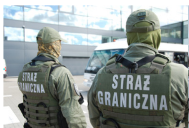
Funkcjonariusze z Zespołu Interwencji Specjalnych w porcie lotniczym.

Informacje na temat naboru zamieszczone są na stronie internetowej oddziału http://www.morski.strazgraniczna.pl w zakładce „Rekrutacja do służby w MOSG”. W Morskim Oddziale Straży Granicznej można kontaktować się z koordynatorami ds. naboru do służby: dla województwa zachodniopomorskiego: tel. 721-960-123, dla pozostałych województw: tel. 797-337-256, 721-961-599; 722-124-116.