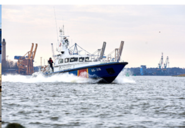
Jednostka pływająca SG-216.