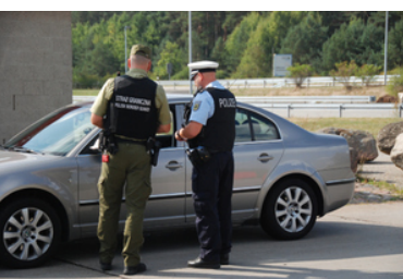
Wspólny patrol funkcjonariuszy SG i BPOL.