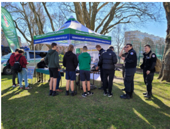
Wojewódzki konkurs strzelecki w Szczecinie.