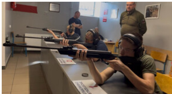
Wojewódzki konkurs strzelecki w Szczecinie.