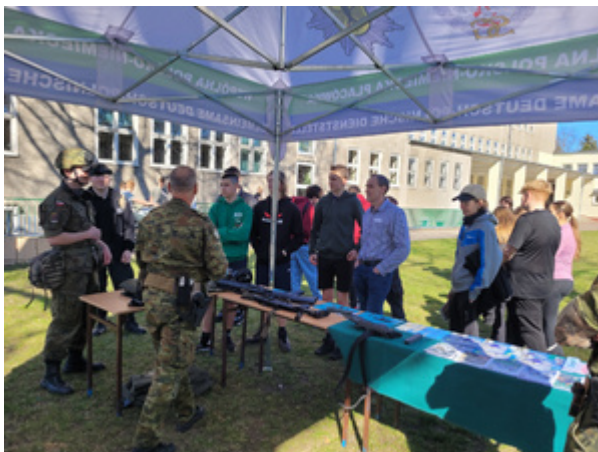
Wojewódzki konkurs strzelecki w Szczecinie.