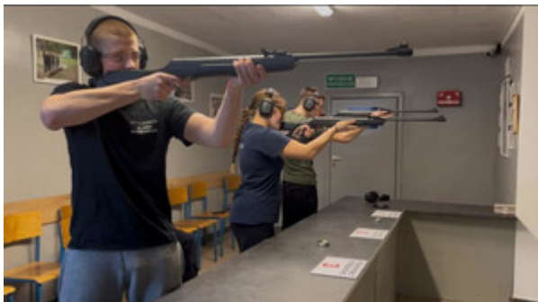
Wojewódzki konkurs strzelecki w Szczecinie.