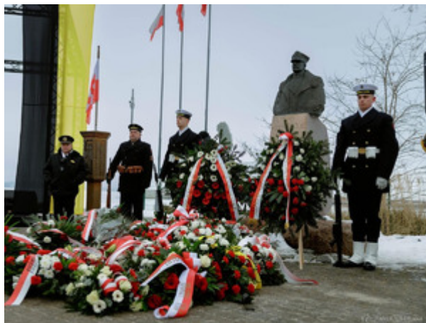
106. rocznica Zaślubin Polski z Morzem - Morski Oddział Straży Granicznej