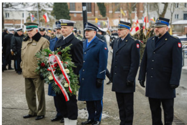
106. rocznica Zaślubin Polski z Morzem - Morski Oddział Straży Granicznej

Rocznice zaślubin upamiętniono również w Placówce Straży Granicznej we Władysławowie, która nosi imię gen. Józefa Hallera oraz na najnowszej pełnomorskiej jednostce pływającej SG-301 Generał Józef Haller.