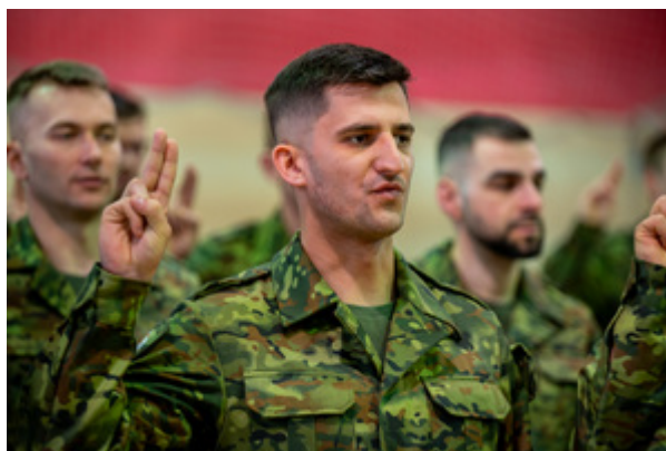
Ślubowanie nowych funkcjonariuszy w MOSG.