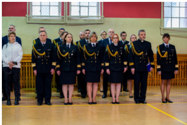
Ślubowanie nowych funkcjonariuszy w MOSG.