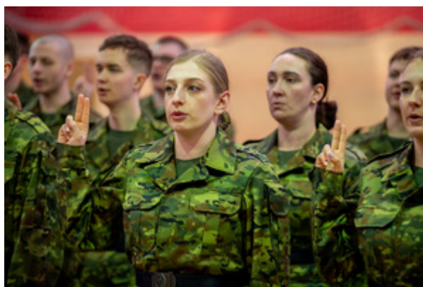
Ślubowanie nowych funkcjonariuszy w MOSG.