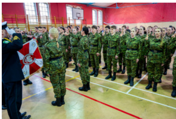
Ślubowanie nowych funkcjonariuszy w MOSG. Fot. Ł. Zwoliński