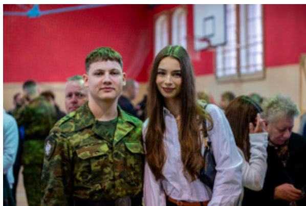
Ślubowanie nowych funkcjonariuszy w MOSG.