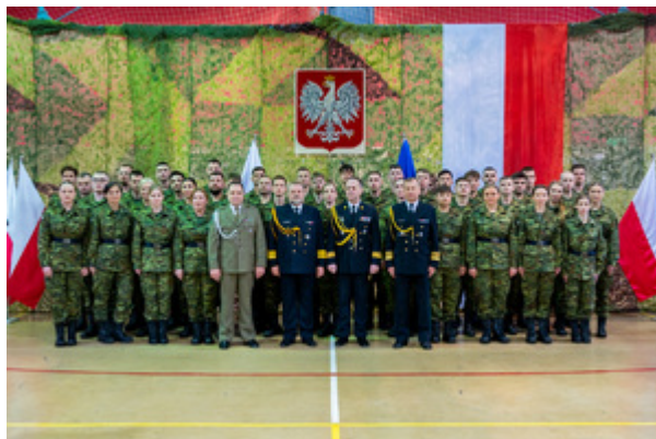
Ślubowanie nowych funkcjonariuszy w MOSG.