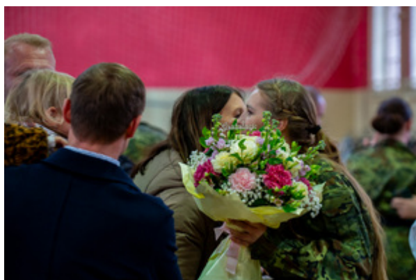
Ślubowanie nowych funkcjonariuszy w MOSG.