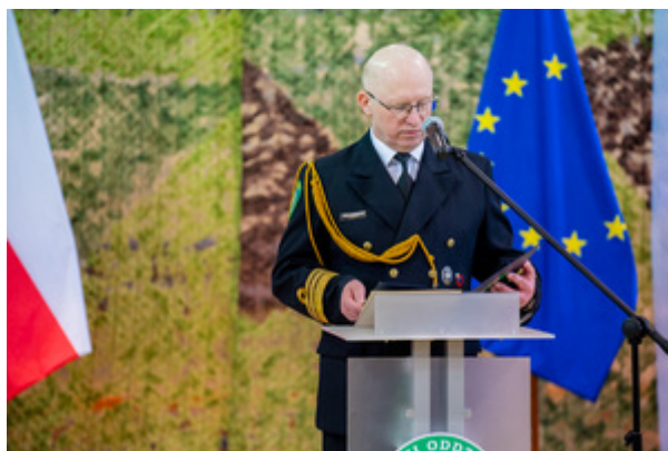
Ślubowanie nowych funkcjonariuszy w MOSG. Fot. Ł. Zwoliński