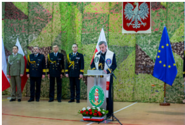
Ślubowanie nowych funkcjonariuszy w MOSG.