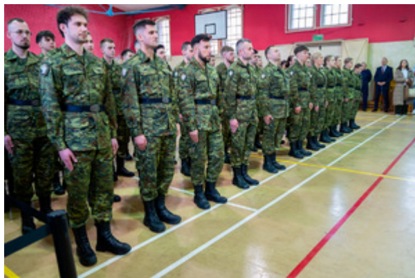
Ślubowanie nowych funkcjonariuszy w MOSG.