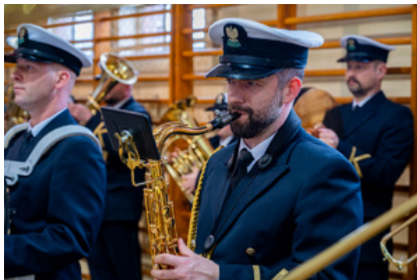
Ślubowanie nowych funkcjonariuszy w MOSG.