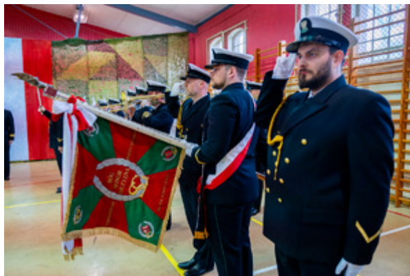
Ślubowanie nowych funkcjonariuszy w MOSG. Fot. Ł. Zwoliński