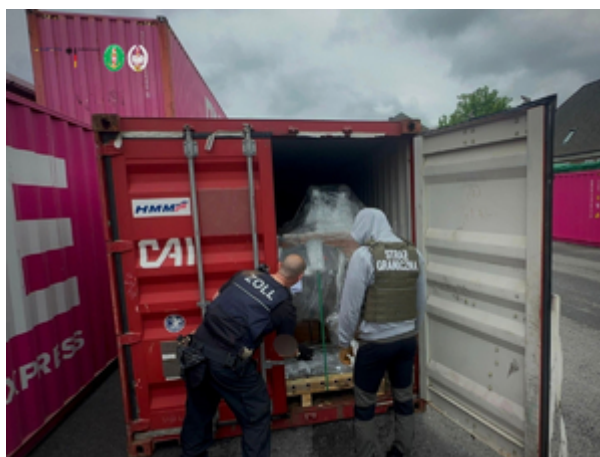
Funkcjonariusze z Morskiego Oddziału Straży Granicznej w Gdańsku rozbili międzynarodowy gang

Działania te potwierdzają wysoką skuteczność współpracy Morskiego Oddziału Straży Granicznej z europejskimi partnerami w walce z międzynarodową przestępczością narkotykową. To wyraźny sygnał, że przestępcy wykorzystujący globalne szlaki transportowe nie mogą liczyć na bezkarność.