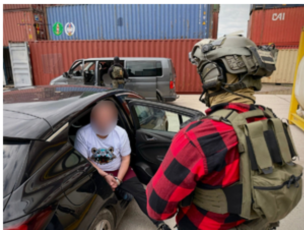
Funkcjonariusze z Morskiego Oddziału Straży Granicznej w Gdańsku rozbili międzynarodowy gang