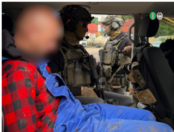
Funkcjonariusze z Morskiego Oddziału Straży Granicznej w Gdańsku rozbili międzynarodowy gang