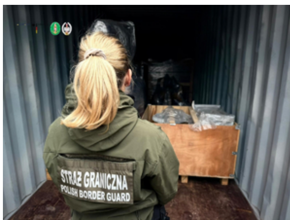
Funkcjonariusze z Morskiego Oddziału Straży Granicznej w Gdańsku rozbili międzynarodowy gang