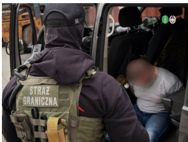
Funkcjonariusze z Morskiego Oddziału Straży Granicznej w Gdańsku rozbili międzynarodowy gang