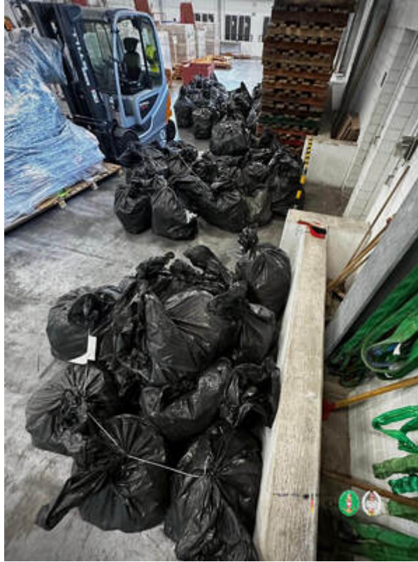
Funkcjonariusze z Morskiego Oddziału Straży Granicznej w Gdańsku rozbili międzynarodowy gang