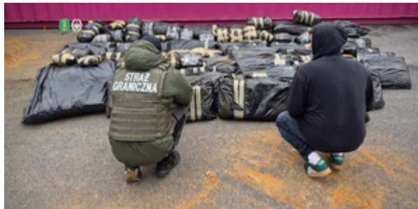
Funkcjonariusze z Morskiego Oddziału Straży Granicznej w Gdańsku rozbili międzynarodowy gang