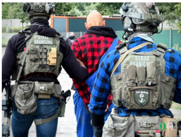
Funkcjonariusze z Morskiego Oddziału Straży Granicznej w Gdańsku rozbili międzynarodowy gang