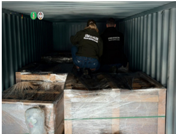
Funkcjonariusze z Morskiego Oddziału Straży Granicznej w Gdańsku rozbili międzynarodowy gang