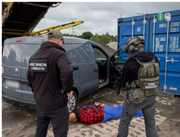
Funkcjonariusze z Morskiego Oddziału Straży Granicznej w Gdańsku rozbili międzynarodowy gang