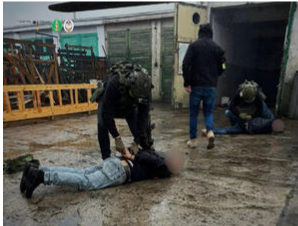
Funkcjonariusze z Morskiego Oddziału Straży Granicznej w Gdańsku rozbili międzynarodowy gang