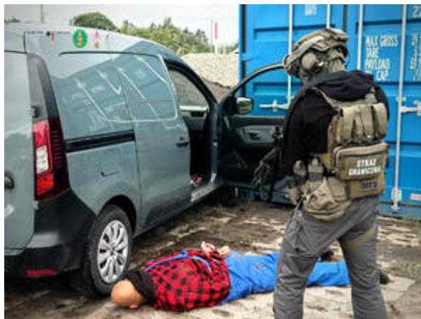
Funkcjonariusze z Morskiego Oddziału Straży Granicznej w Gdańsku rozbili międzynarodowy gang