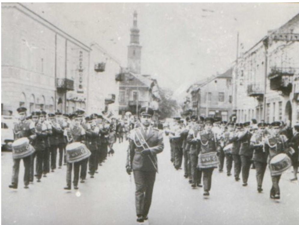
Orkiestra Kaszubskiej Brygady Wojsk Ochrony Pogranicza. Przemarsz ulicami jednego z miast Wybrzeża.