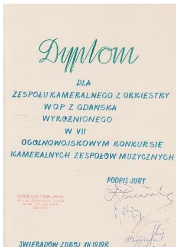
Dyplom z wyróżnieniem dla zespołu kameralnego orkiestry, z konkursu zespołów muzycznych w Świeradowie w 1979 r.

W 1981 roku Orkiestra Kaszubskiej Brygady Wojsk Ochrony Pogranicza otrzymała