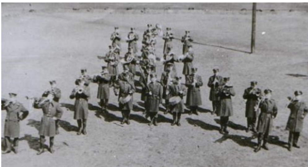
Pokaz msztry paradnej. Orkiestra Kaszubskiej Brygady Wojsk Ochrony Pogranicza.

Orkiestra występowała w czasie różnych uroczystości okolicznościowych, świąt państwowych, wojskowych, a także kościelnych. Dawała też koncerty i pokazy dla dzieci i młodzieży w szkołach.