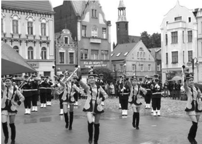
Tamburmajorki Pałacu Młodzieży w Gdańsku z orkiestrą Morskiego Oddziału Straży Granicznej. Rewia orkiestr. Tczew, 2007 r.

W latach 90-tych zaczęto wprowadzać do repertuaru muzykę rozrywkową. Dziś orkiestra Morskiego Oddziału Straży Granicznej poza muzyką marszową ma w swym repertuarze muzykę popularną, filmową, jazzową, a także klasyczną takich kompozytorów jak: Johann Sebastian Bach, Wolfgang Amadeusz Mozart, Johannes Brahms, Modest Musorgski, George Gershwin, Astor Piazzolla.