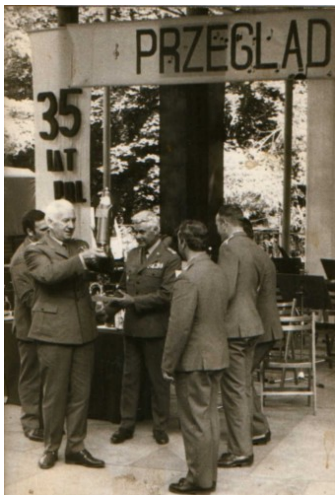
Akt wręczenia nagrody wyróżnienia orkiestrze Kaszubskiej Brygady Wojsk Ochrony Pogranicza . Lubań, 1979 r.

Istniały zespoły kameralne złożone z członków orkiestry, które brały udział w przeglądach wojskowych zespołów muzycznych. W 1979 roku jeden z zespołów otrzymał wyróżnienie w VII Ogólnowojskowym Konkursie Kameralnych Zespołów Muzycznych w Świeradowie Zdroju.