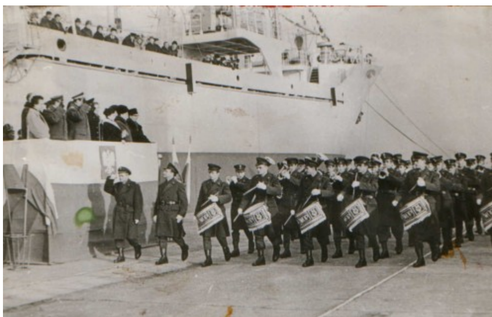
Orkiestra Kaszubskiej Brygady Wojsk Ochrony Pogranicza podczas nadania statkowi im. mjr H. Sucharskiego.

W 1979 roku orkiestra otrzymała wyróżnienie na Przeglądzie Orkiestr Wojskowych w Lubaniu.