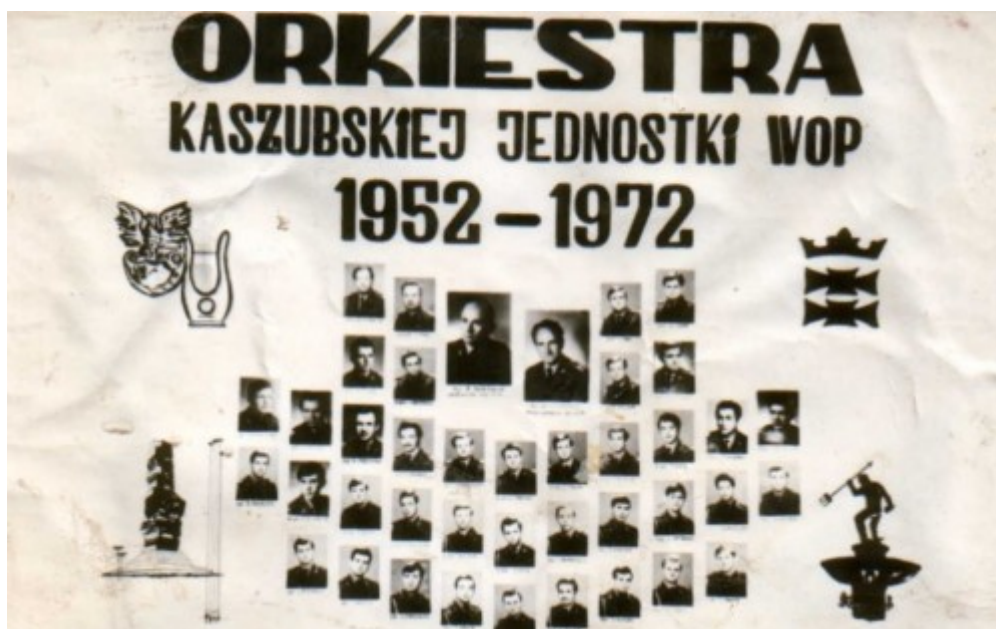
Skład Orkiestry Kaszubskiej Jednostki Wojsk Ochrony Pogranicza w 1972 r.