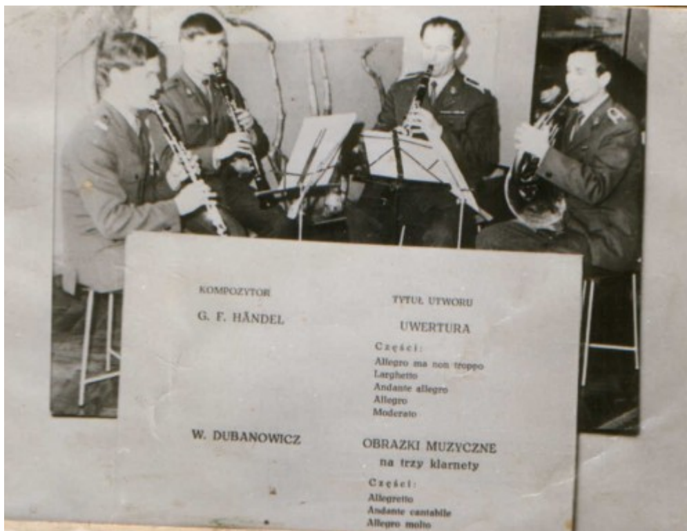
Jeden z zespołów orkiestry Kaszubskiej Brygady Wojsk Ochrony Pogranicza.